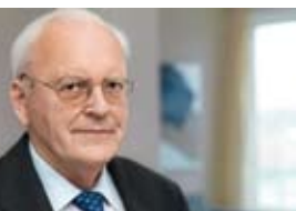
Prof. Dr. Roman Herzog

Nicht erst seit der Wirtschaftskrise wird Kritik geübt an unserer Wirtschaftsordnung und werden Forderungen laut nach mehr sozialer Gerechtigkeit.